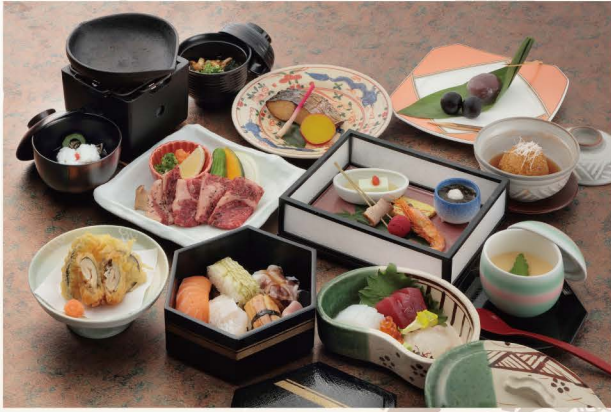
和会席：睡蓮 (イメージ)