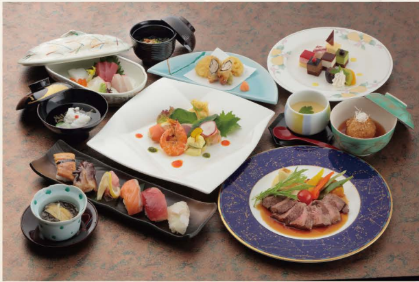
和洋折衷：花波 (イメージ)